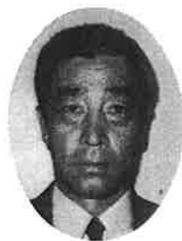
高岡市民病院 整形外科部長