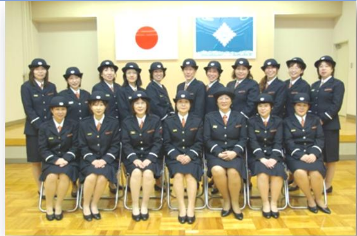
団員20名 チームワークで頑張っています！

今年4月に大沢野女性分団が誕生しました。18年間の消防活動を経て、団員一同が地域の火災予防の広報活動を展開し、「子供から高齢者までの防災」を目標に、出前講座を開催しています。今回、機関紙「火まわり通信」を発行し、より皆様方に慕われる消防団を目指し頑張っていく所存ですので、今後も皆様のご理解とご協力をお願い申し上げます。